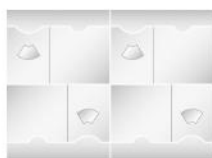
Posizione di fornitura