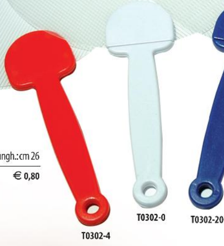
T0302-4 T0302-0 T0302-20

T0302 ▶ Ventaglio in PP. Ø cm 17 Lungh.: cm 26 Imballi: 10/300 € 0,80